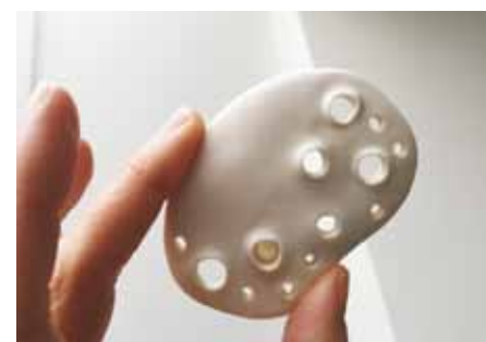
Nr. 2, 2a en 2b. Adem me (2), 72x50x7 mm, 2020. Maaïke van de Gevel

aan het werk beleeft. Gaandeweg het bekijken en voelen neemt de penning langzaam je temperatuur over.'