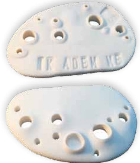
Nr. 9 en 9a. Ik adem me, 72x45x7 mm, porselein, 2020. Maike van de Gevel

Deze unieke werkstukken nemen een aparte plaats in onze wereld van de penningkunst.