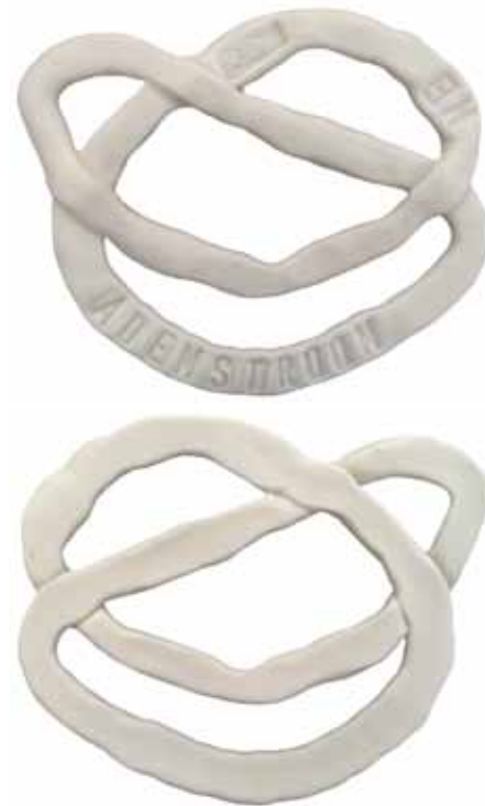
Nr. 4 en 4a. Ademstroom me, 82x63x5 mm, porselein, 2019. Maaïke van de Gevel

Ik adem je door de nacht is cirkelvormig met alleen de tekst: IK ADEM JE (afbeelding 5). Het oppervlak is ongelmatig door enige kleine oneffenheden die zijn ontstaan door rijst door de natte porselein te kneden. Tijdens het bakproces is de rijst weggebrand en heeft zijn sporen in de vorm van openingen achtergelaten. Op de keerzijde staat het vervolg van de tekst: DOOR DE NACHT (afbeelding 5a). Aan de linkerzijde boven de tekst staat haar geveltje met M. De kleine gaatjes en de geringe dikte hebben een functie, want in de hand genomen schijnt het licht er fraai door-