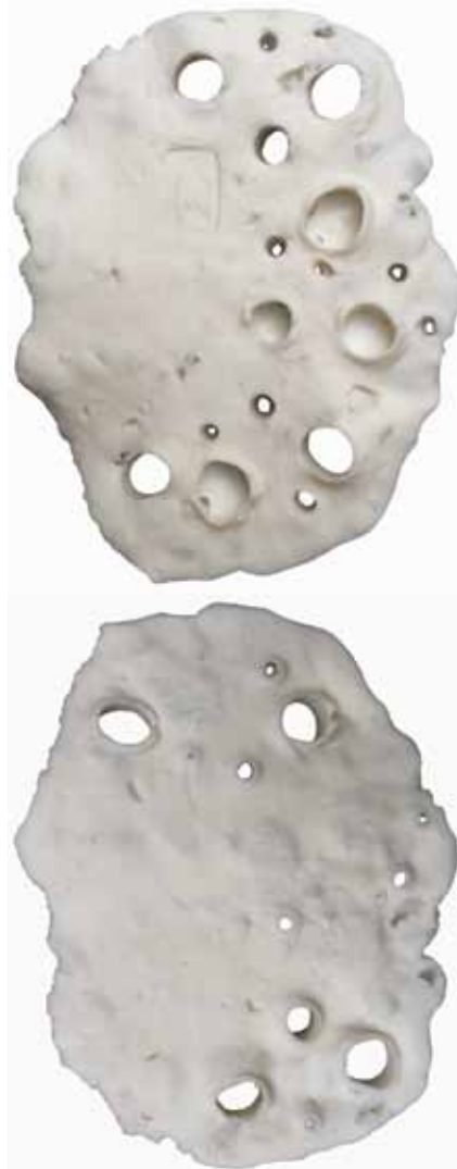
Nr. 8 en 8a. Ademruimte, 76x56x5 mm, porselein met verglaasde rijst, 2020. Maike van de Gevel

Van de Gevels oeuvre gaat over lucht, adem en vorm, die op geheel eigen manier worden