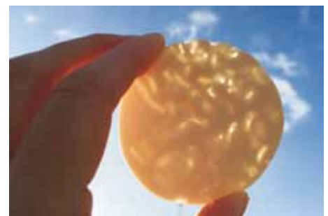
Nr. 5, 5a en 5b. Ik adem je door de nacht, 59x3 mm, porselein, 2020. Maaïke van de Gevel